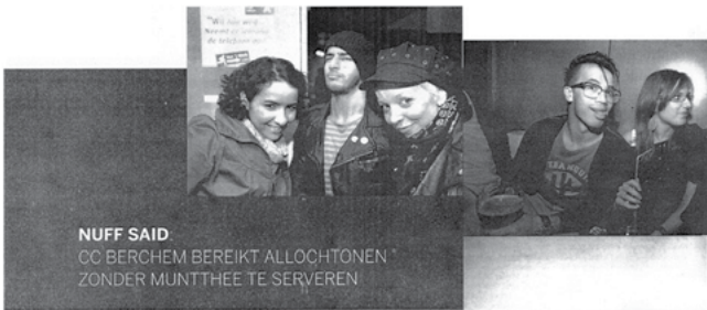
NUFF SAID CC BERCHEM BEREIKT ALLOCHTONEN ZONDER MUNTTHÉE TE SERVEREN