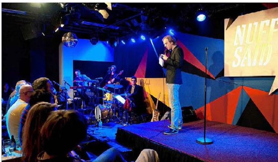
‘Nuff Said houdt de afstand tussen artiesten publiek bewust klein, in oktober ook in Turnhout.