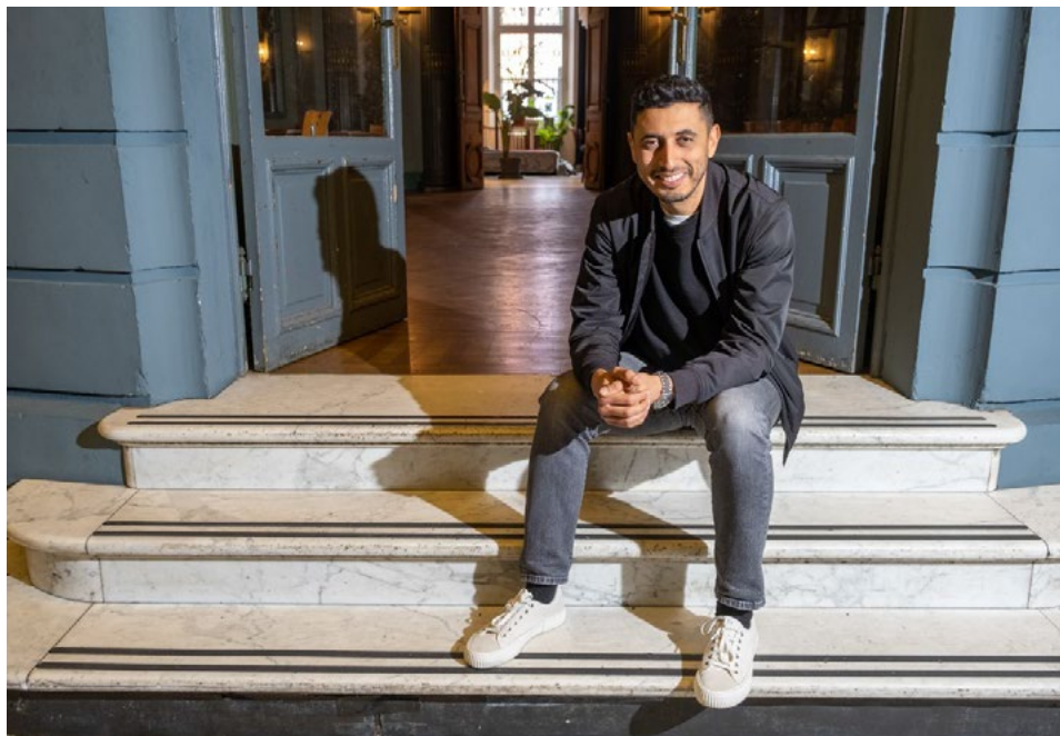
‘Ik zou nochtans nog altijd heel graag iets maken voor tv.