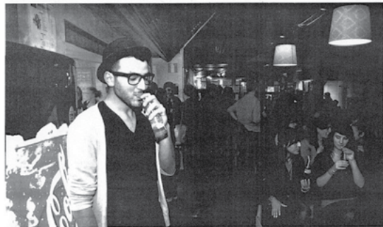
Het is het relaxte sfeertje dat van Nuff Said zo'n succes maakt.

'We vinden het wel belangrijk om ook de allochtonen te bereiken, dat is iets anders. In hen bijvoor-beeld goed bevriend met Johan Peels. Ik ging naar hem kijken in een zaal van duizend man - daar met geen relatie. Maar ik kan trouwen, dat vind ik dan jaansen. Dus hebben we een programmaover- op Nuff Said. En de volgende keer zijn er toch een twintigtal men-aren die hem bij ons gezien heb-ben, maar zijn show gaan kijken.'