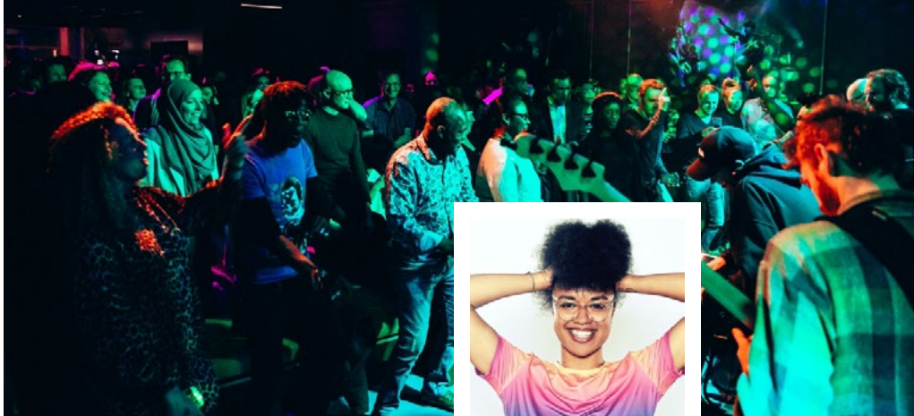
'Nuff Said, vorige editie.

Dertien jaar geleden zag 'Nuff Said het licht in ccBE, het Berchemse cultuurcentrum dat vandaag de naam Corso draagt. Ondertussen is het comedy- en muziekconcept uitgegroeid tot een vast begrip dat ook buiten de stadsgrenzen navolging heeft gekregen. Omdat 'Nuff Said in ccBE uit zijn voegen begon te barsten, koos het voor een nieuw onderkomen: De Studio op het Mechelseplein.