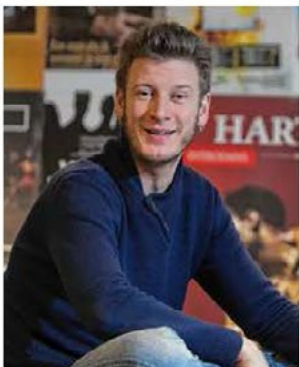
Ook komiek Wouter Deprez zal erbij zijn op 2 oktober.