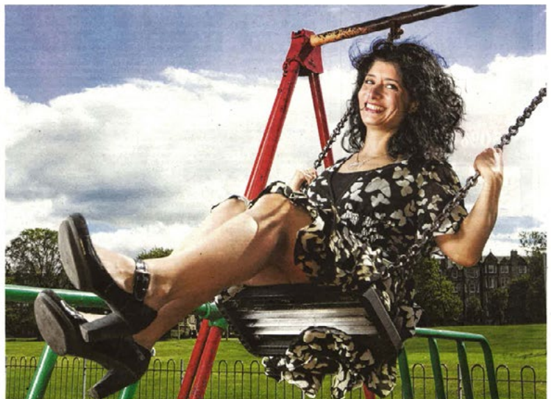
Shappi Khorsandi is de identiteitscrisis voorbij.

Geen gebaseerd Denk nu niet dat Khorsandi op het podium alleen praat over verschillen en overeenkomsten tussen de bevolkingsgroepen, en de noot opbouwende strijd voor aanvaarding en erkenning. Ze is even goed een moderne femme vrouw, theaterdiplooma op zak, geschieden en een tijdlang afwisselende moeder. Eerder dit jaar zette ze haar tweede kind op de wereld. Ook dat wil ze vertellen, niet met een lawe van grappen maar eerder rustig keuvelend met het publiek. Shappi's nieuwe show Dirty Laak and Hopedoch gaat over 'een klein beetje zijn en opgroeien, en de frustratie als je geen pensioen krijgt te zien. Ze noemt zichzelf 'niet serieus' op het podium. Ik zag gewoon wat ik denk.