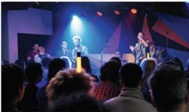
Het cultuurcentrum in Berchem is al tien jaar lang het decor van de culturele avonden van ‘Nuff Said.

Na een decennium draait ‘Nuff Said op volle toeren. Ondertussen is het collectief actief in verschillende steden en organiseert het twintig edities per jaar. Avonden waar comedy, woord en muziek centraal staan. Trouwe huisband is de Antwerpse groep Brzvvil. Gastheer van dienst is al jaar en dag theatermaker en acteur Johan Pettit. Vaste locatie is het Berchemse cultuurhuis ccbe. Maar zo mogelijk nog centraler in het hele ‘Nuff Said-verhaal staat diversiteit. “Als